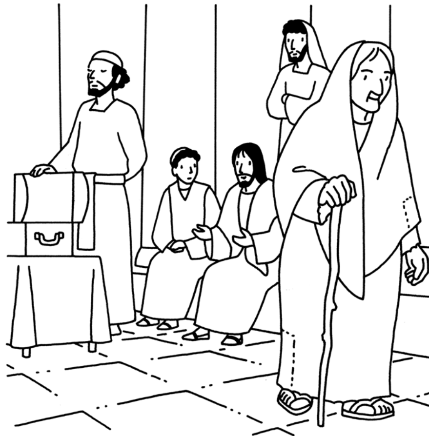
Editions Mame "Je colorie l'Évangile du dimanche"

« Cette pauvre veuve a mis plus que tous les autres. » Mc 12, 43