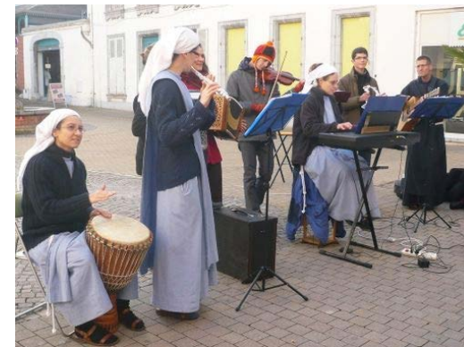
Évangélisation de rue à Tarbes

L'évangélisation peut prendre différentes formes, comme la prédication, la distribution de Bibles ou de tracts, journaux et magazines, par les médias, le témoignage, l'évangélisation de rue, et de bien d'autres moyens.