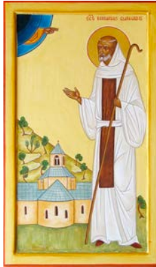
Icône de Saint Bernard