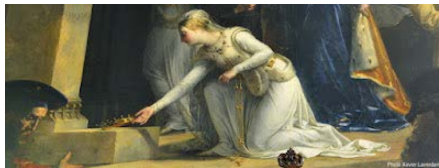
Ste Élisabeth de Hongrie déposant sa couronne au pied de l'autel

Extrait de "Wikipedia" et " ofs-fraterniteregionaledemartinique.fr "