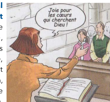
Antège Le Schnevé

Cependant, pour que le peuple puisse plus facilement donner une réponse en forme de psalmodie, quelques textes de refrains et de psaumes pour les divers temps de l'année ou pour les différentes catégories de saints ont été sélectionnés, qui peuvent être employés quand le psaume est chanté, à la place du texte correspondant à la lecture. Si le psaume ne peut être chanté, on le récite de la manière la plus apte à favoriser la méditation de la parole de Dieu.